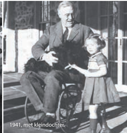
1941, met kleindochter.

verve in voor de strijd tegen polio. In dat kader richtte hij de March of Dimes op, genoemd naar de toen veel beluisterde radioshow March of Time . Deze grote en breed gesteunde stichting zamelde geld in voor onderzoek naar een poliovaccin. Het was alom bekend dat Roosevelt juist deze stichting opgericht had omdat hij die ziekte zelf overleefd had.