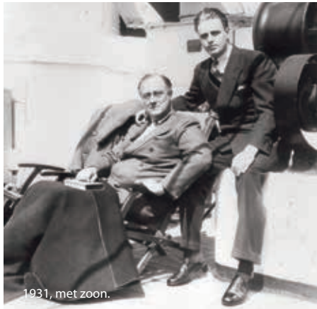
1931, met zoon.

De trailer verbindt de ‘Fear’-uitspraak met de oorlog of zijn ziekte – beide nu in de herinnering aan Roosevelt prominent. Historisch is dat niet juist, maar retorisch werkt het wel. Het ci-